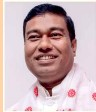
रामेश्वर तेली खाद्य प्रसंस्करण उद्योग राज्य मंत्री