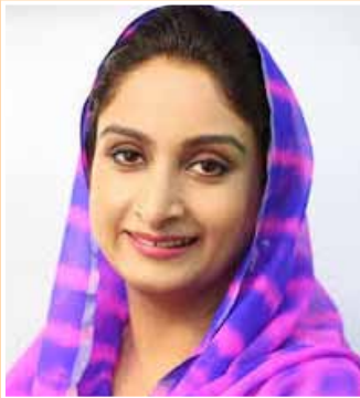
हरसिमरत कौर बादल खाद्य प्रसंस्करण उद्योग मंत्री